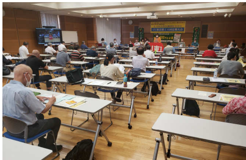
リモートとリアルで開催されたCU東京第14回大会 (22/07/23)

江東区労働組合総連合 〒135-0011 江東区扇橋 1-12-20 江東教育会館内 Tel.03-5606-5285 Fax03-3649-0131