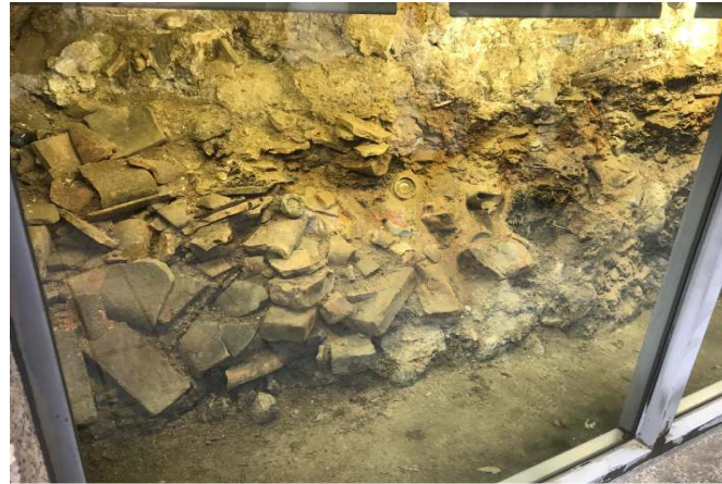
原爆投下直後の地層がそのまま保存されている爆心地。