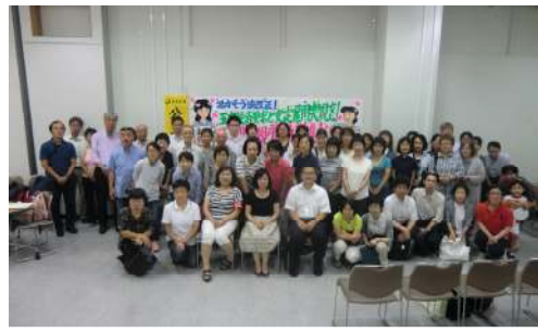
集会参加者で記念撮影（17/07/21）