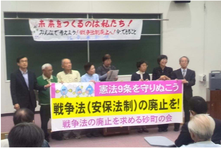
活動の報告をする戦争法の廃止を求める砂町の会の仲間 (15/11/17)

江東区労働組合総連合 〒135-0011 江東区扇橋 1-12-20 江東教育会館内 Tel.03-5606-5285 Fax03-3649-0131